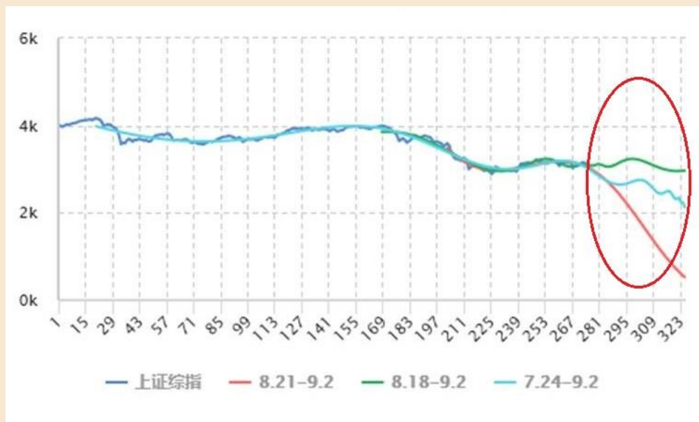
图2 中证 500 指数 30 分钟线实际走势与拟合效果